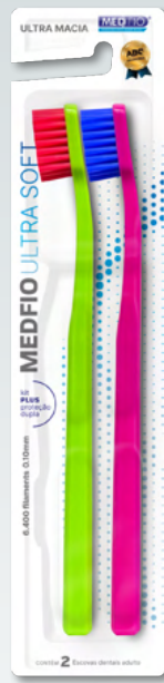
03.1103 Escova Ultra Macia Ultra Soft 2x1 CX: 24