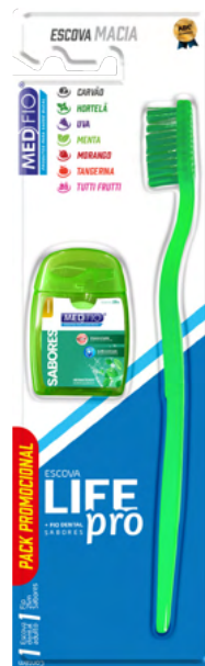
03.0174 Escova Macia Life Pro + Fio Sabores 25m CX: 12