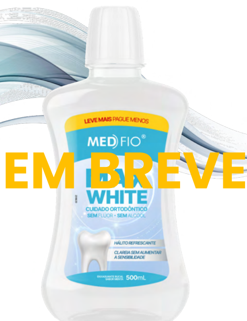
10.0042 Enxaguante Bucal Max White 500ml CX: 12