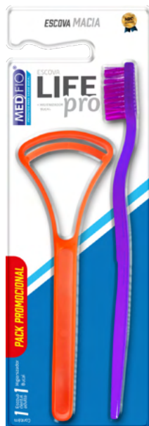
03.0986 Escova Macia Life Pro + Hig. de Língua CX: 12