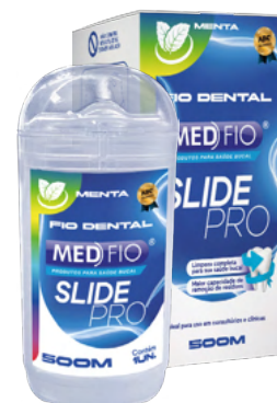
03.0195 Fio Dental Slide Pro 500m CX: 24

A escova Slide Pro foi desenvolvida para limpar ao redor dos dentes, auxiliando na remoção da placa bacteriana. Ela conta um cabo ergonômico translúcido.