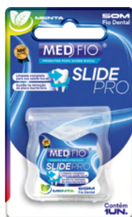
03.0155 Fio Dental Slide Pro 50m CX: 24