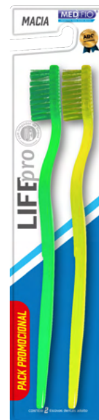
03.1105 Escova Macia Life Pro 2x1 CX: 24