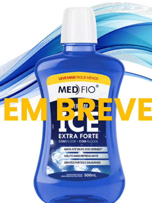
10.0039 Enxaguante Bucal Ice Extra Forte 500ml CX: 12

Com sensação intensa de limpeza, o Enxaguante Bucal Ice Extra Forte fortalece a rotina de higiene bucal e contribui para dentes mais saudáveis. Sua ação antimicrobiana elimina até 99,9% dos germes, garantindo uma proteção poderosa e duradoura.