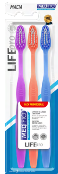
03.0250 Escova Macia Life Pro 3x1 CX: 12