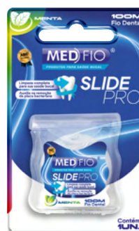
03.0145 Fio Dental Slide Pro 100m CX: 24