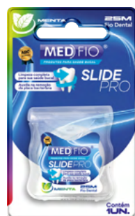
03.0160 Fio Dental Slide Pro 25m CX: 24