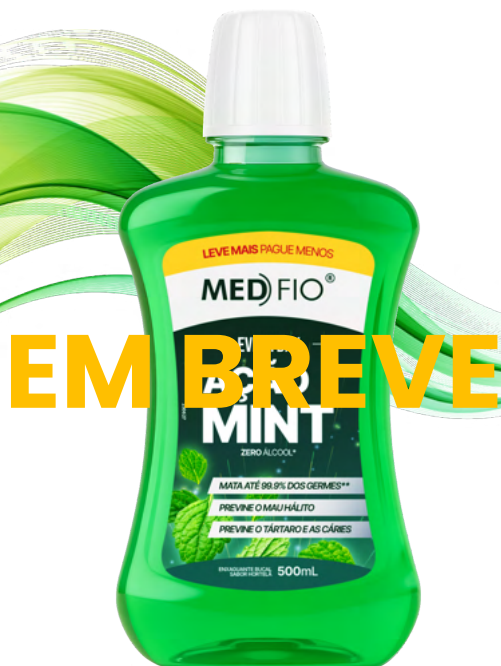
10.0038 Enxaguante Bucal Ação Mint 500ml CX: 12