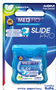
03.0220 Fita Dental Slide Pro 40m CX: 24