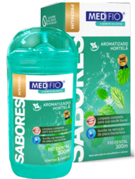
03.0147 Fio Dental Sabores Hortelã 300m CX: 24