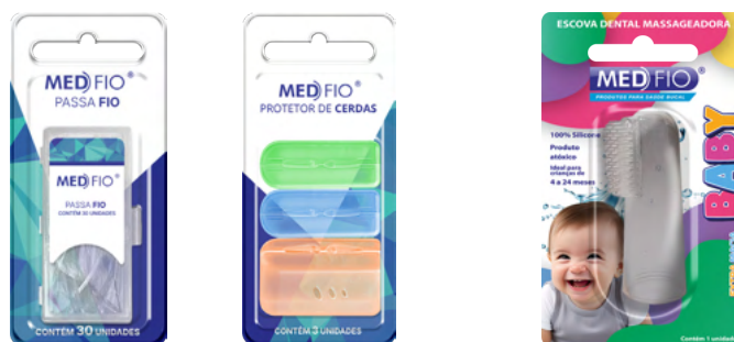
03.0135 Passa-Fio CX: 24

Nossos acessórios foram desenvolvidos para complementar o cuidado diário, oferecendo soluções práticas para higiene, organização e limpeza completa . Produtos projetados para facilitar a rotina e garantir resultados mais eficientes.