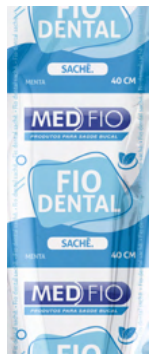
03. 0168 Sachê Fio Dental Menta 40cm CX: