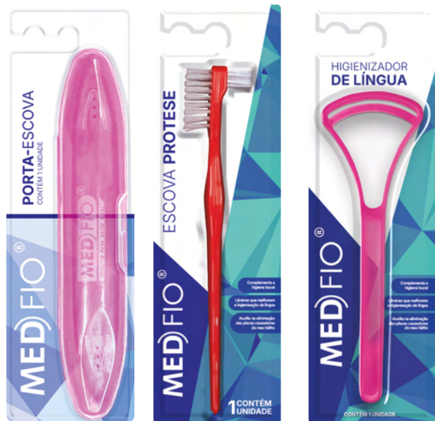
03.0191 Porta-Escova CX: 12