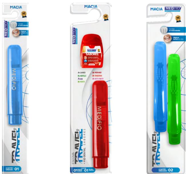
03.0214 Escova Macia Travel CX: 36

Essa escova ainda possui um espaçamento no meio com cerdas arredondadas que auxiliam no polimento, beneficiando até mesmo pessoas com aparelhos ortodônticos.