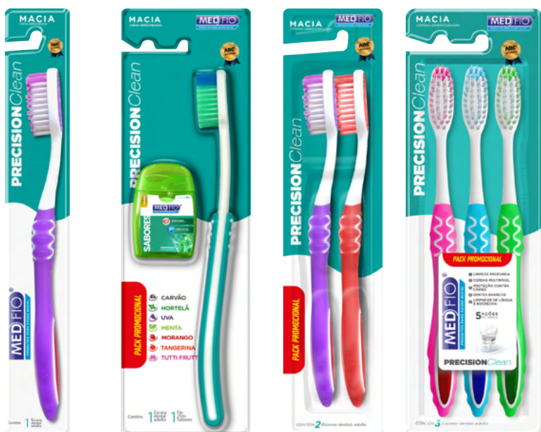
03.0211 Escova Macia Precision Clean CX: 24