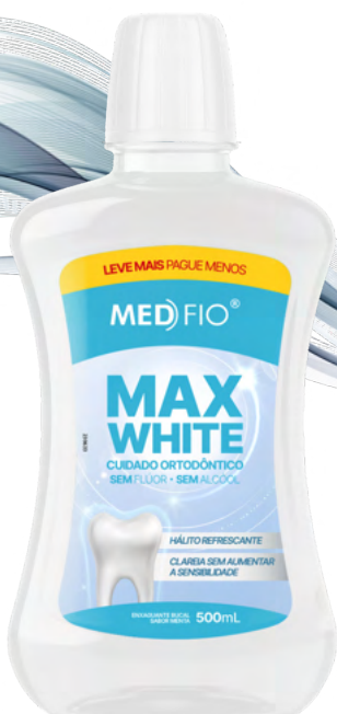
10.0042 Enxaguante Bucal Max White 500ml CX: 12

Com sensação intensa de limpeza, o Enxaguante Bucal Ice Extra Forte fortalece a rotina de higiene bucal e contribui para dentes mais saudáveis. Sua ação antimicrobiana elimina até 99,9% dos germes, garantindo uma proteção poderosa e duradoura.