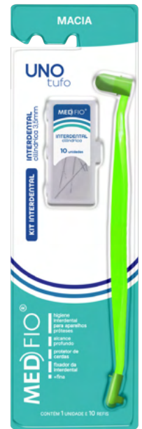
03.0089 Kit Uno Tufo + Interdental Cilíndrica 3,5mm (10 Refis) CX: 24