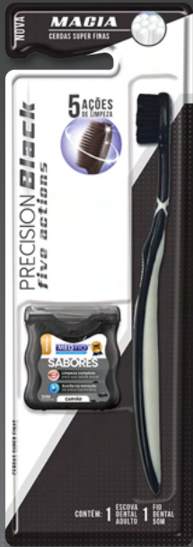
03.1014 Escova Macia Precision Black + Fio Carvão Ativado 50m CX: 12