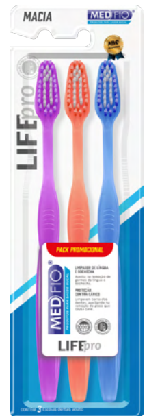
03.0256 Escova Macia Life Pro CX: 24