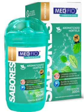
03.0147 Fio Dental Sabores Hortelã 300m CX: 24