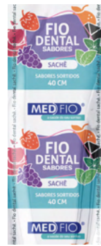
03.0212 Sachê Fio Dental Sabores 40cm CX: