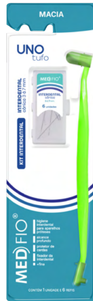
03.0083 Kit Uno Tufo + Interdental Cônica 3 à 7mm (6 Refis) CX: 24