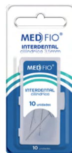
03.0052 Refil Interdental Cilíndrica 3,5mm (10 Un) CX: 24

Ideal para a limpeza profunda entre os dentes, aparelhos e implantes. Suas cerdas delicadas removem resíduos e placa bacteriana em áreas de difícil acesso, garantindo uma higiene completa e eficaz.