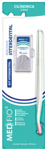
03.0092 Kit Interdental Cilíndrica 3,5mm (10 Refis) CX: 24