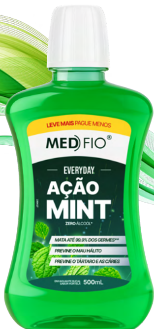
10.0038 Enxaguante Bucal Ação Mint 500ml CX: 12