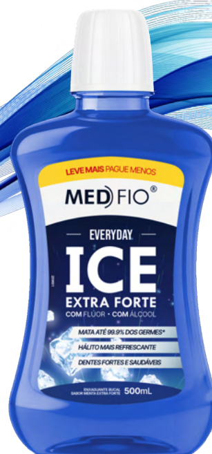
10.0039 Enxaguante Bucal Ice Extra Forte 500ml CX: 12

Promovendo uma refrescância duradoura, o Enxaguante Bucal Ação Mint ajuda a manter a boca limpa, protegida e livre do mau hálito. Sua fórmula sem álcool auxilia na prevenção de tártaro e cáries, enquanto elimina até 99,9% dos germes que comprometem a saúde bucal.