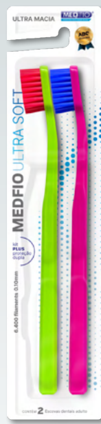
03.1103 Escova Ultra Macia Ultra Soft 2x1 CX: 24