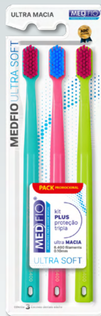
03.1104 Escova Ultra Macia Ultra Soft 3x1 CX: 12