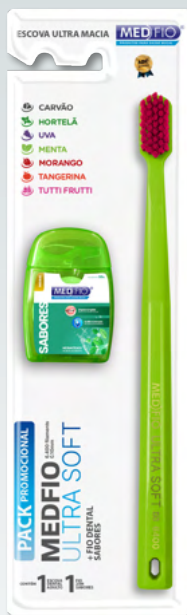
03.1100 Escova Ultra Macia Ultra Soft + Fios Sabores 25m CX: 12