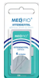
03.0058 Refil Interdental Cônica 3 à 7mm (6 Un) CX: 24