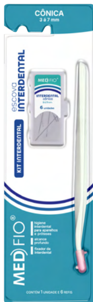
03.0093 Kit Interdental Cônica 3 à 7mm (6 Refis) CX: 24